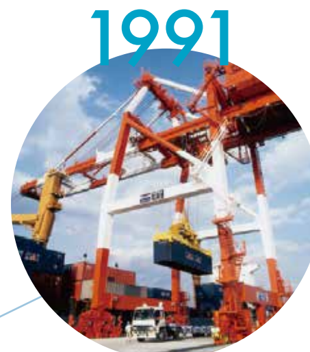
国際海上コンテナ揚積作業

大阪港とともに歩み続ける中谷運輸、岡山におけるグローバル物流のパイオニア・中谷興運、エンジニアリングのスペシャリスト・中谷機工、石油関連業務のエキスパートである中谷エネテック…中谷グループ各社は、それぞれの分野で独自性を大切に、より広く、より深く、事業を発展させてきました。技術とまごころの「人間力」で社会のさまざまな分野を支えている2000名の中谷マンたち。いま、その活躍の舞台は海外にも広がっています。