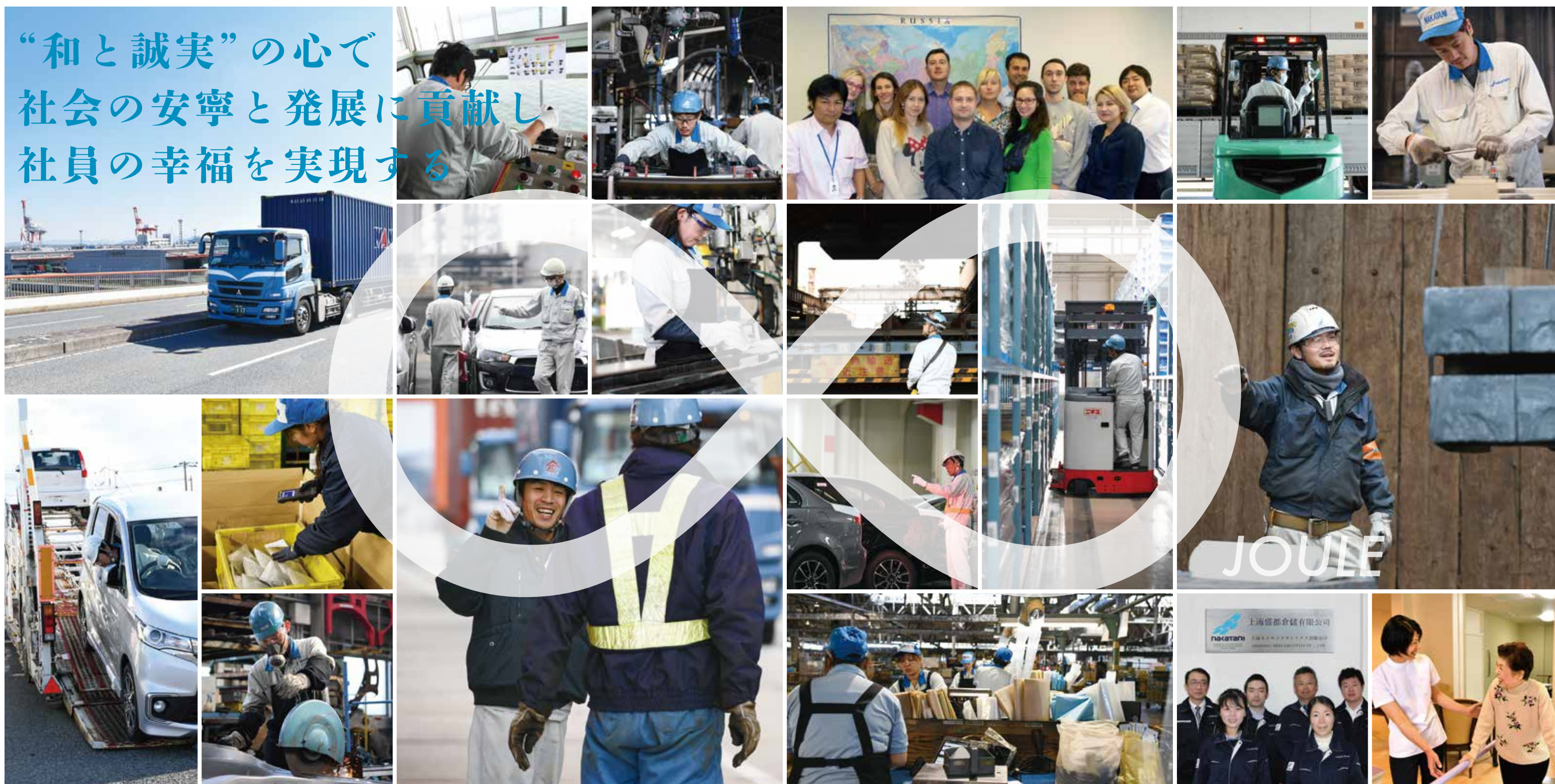
[中谷マン熱量の数字 (※JOULE エネルギー・仕事・熱量・電力量の単位)]