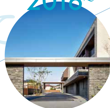
ヴィラ・プランタン おかやま (2016年オープン)